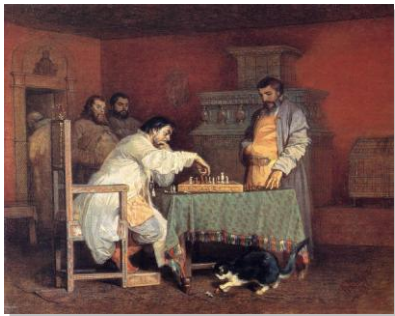
Schwarz Viatshelslav (1838/69) - Vita privata degli Zar russi, 1865

Una ricerca del 2011 fatta da Francesco D'Alessandro, giurista dell'Università Cattolica, mostra che l'80% dei mille professionisti interpellati in Lombardia ammette di aver fatto ricorso a strategie di medicina difensivistica almeno una volta nell'ultimo mese.