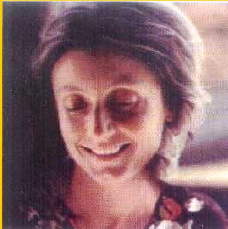
Annalena Tonelli Forlì, 2 Aprile 1943 – Borama, 5 Ottobre 2003