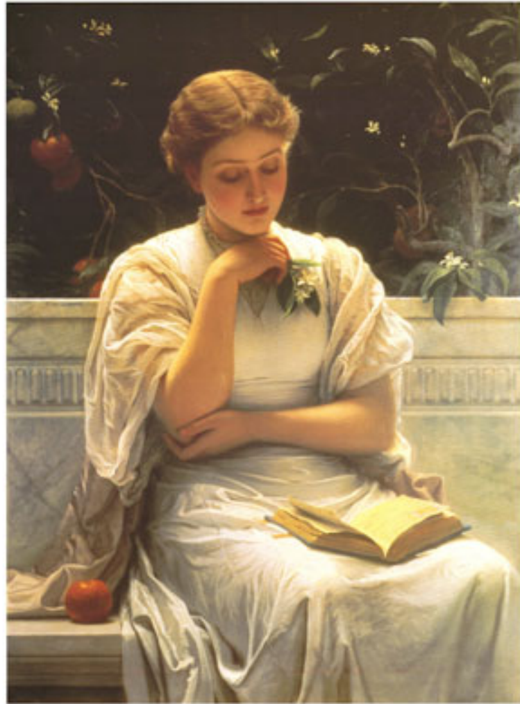
GIRL READING by CHARLES EDWARD FRIESZ