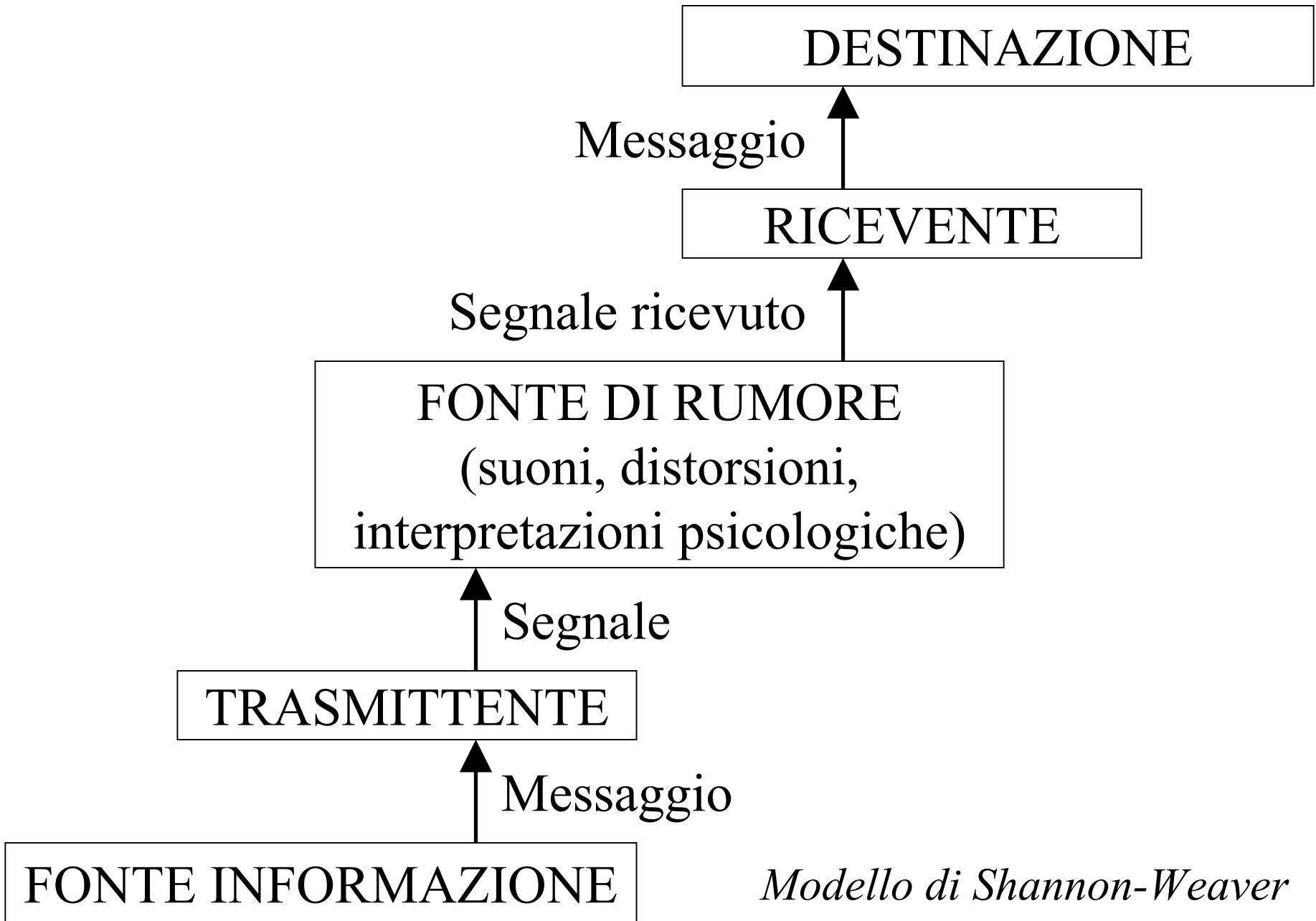
Modello di Shannon-Weaver